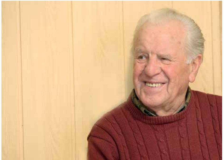
Posebej živo se spominja obdobja med drugo svetovno vojno.

Najprej sem bil v eni kovinski fabriki v Kölnu, potem pa v Düsseldorfu v steklarni. Velika fabrika, bilo je 5000 zaposlenih. Tisti človek, lastnik, je začel z napravico, s peskom, na katerem se jajca kuhajo. S tistim se je polatil in je potem tako napredoval. Še nikoli nisem delal tako, kot sem tam. Ni bilo