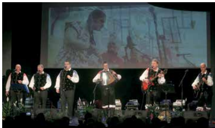
Koncert Ansambla Jelen Lepa moja Notranjska