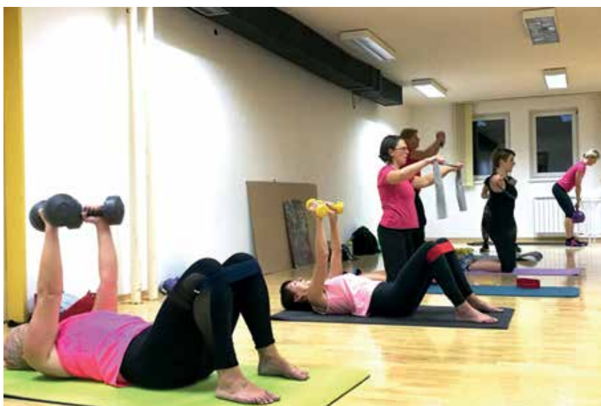
S primernim in prilagojenim ter strokovno vodenim treningom lahko vplivamo na povečanje mišične moči tudi pri starejših.

Proces staranja se začne od prvega dne življenja in starati se pomeni rasti, postajati globlji, modrejši, ali pa, če hočemo, pomeni propadati, se manjšati in postajati neuporaben. Odločitev je na posamezniku. Delo na sebi je res najtežje, a se vedno najbolj spleča! Za naslednjo vadbeno sezono pripravljamo novosti in nove dejavnosti, ki bodo vključevale tudi delavnice, a to naj bo za zdaj še skrivnost. Pridružite se nam!