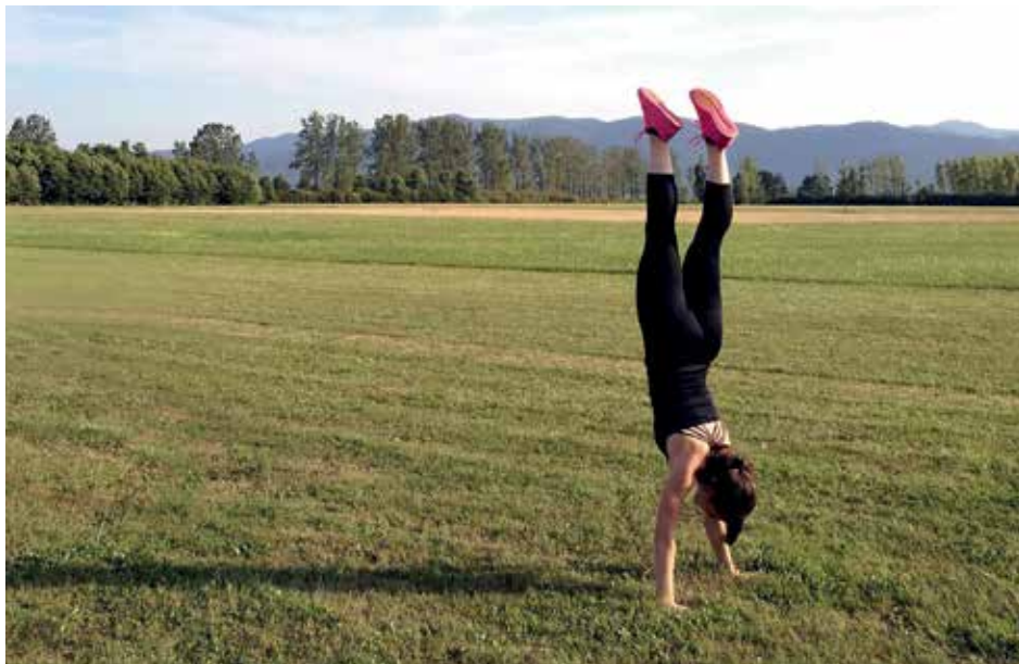
Telesna vadba je tudi imunoterapija, kar pomeni, da deluje protivnetno.

Telesna vadba je tudi imunoterapija, kar pomeni, da deluje protivnetno. Med vadbo mišične celice sproščajo »miokine«, ki vplivajo na zmanjšanje kroničnega vnetja, ateroskleroze, inzulinsko toleranco (diabetes) ali na pojav tumorjev in tudi na zmanjšanje viscelarnega maščevja (to je notranja zamaščenost organov, kar se navzven vidi kot povečan obseg trebuha). Redna in zmerna vadba kaže dobrobiti za imunski sistem, ekstremni treningi pa delujejo oksidativno, kar povzroča vnetne reakcije, porušena je homeostaza.