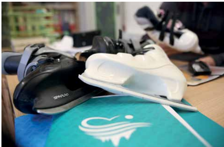
Vsak, ki si drsalke izposodi, mora podpisati, da je seznanjen s stališčem, da je izbira lokacije njegova odgovornost.