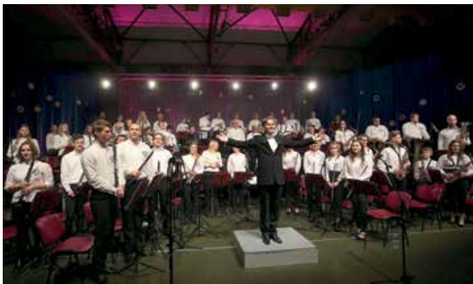
43. božično-novoletni koncert Godbe Cerknica