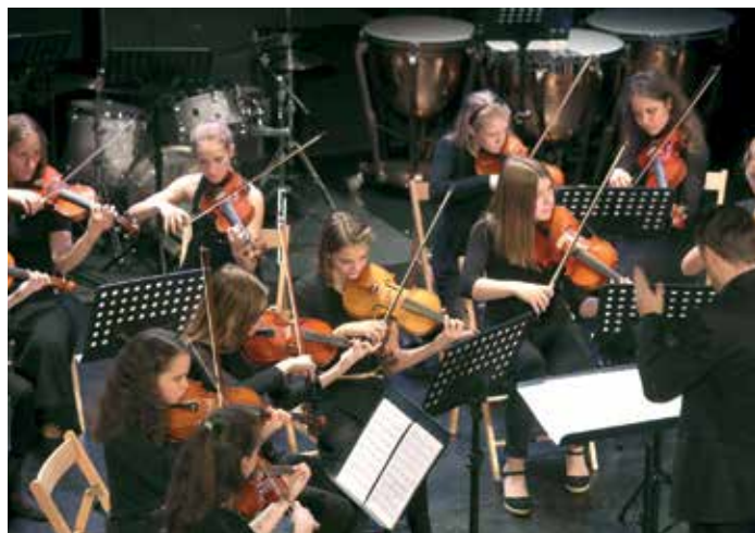
Koncert Glasbene šole Frana Gerbiča Cerknica