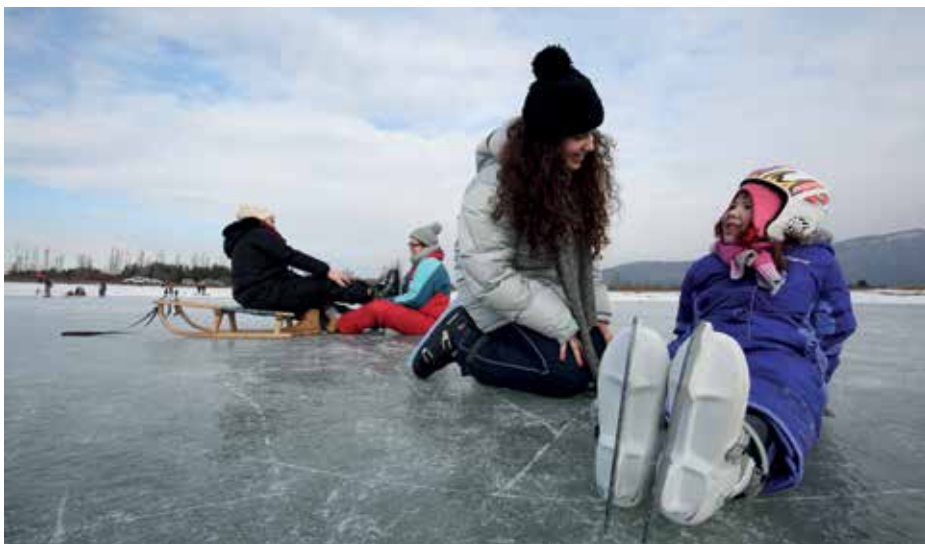
V občini ni organiziranih drسالišč, na katerih bi lahko jamčili varnost.

Kebe se spomni, da je po letu 1960 led na jezeru vztrajal 14 dni in več, drسالci so od Dolenjega Jezera do Gorenjega Jezera in v gostilni pri Vragu pili čaj in drسالci nazaj. Drسالci so tudi do Karlovic. »Na teh drسالkah so igrali tudi hokej, vendar si drسال lahko samo naravnost, le malenkost si lahko zavil. Iz Ljubljane pa so prišli s sodobnimi hokejskimi drسالkami. Na Dolenjem Jezeru so bili najbolj zagnani in