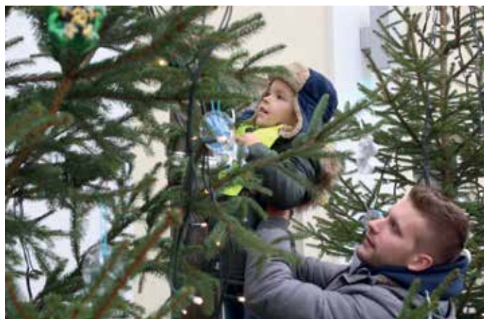
Krašenje jelke pred Kulturnim domom Cerknica