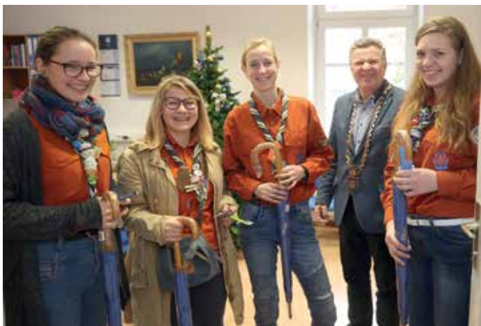
Luč miru na občinsko upravo vsako leto prinesejo cerkniški skavti.