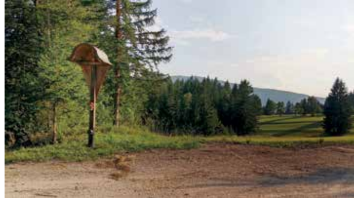
Štefka Šebalj Mikše

Na Kruščem pri zadnji hiši stopimo na kolovozno pot. Sredi no poti prekriva trava z dolgopecljati klaski na visokih kolenčastih steblih, levo in desno pa se bohotijo vitke smreke in bori. Na peščenih delih poti drobne vejice ustavljajo odpadle iglice in suho listje, ki jih ob deževju odnaša voda. Praznino med drevesi sem in tja prekriva praprot. Pri trohnečem panju, obdanem s številnimi glivami in mahom, moramo biti pozorni, da nadaljujemo naravnost, sicer se, če zavijemo levo, znajdemo na asfaltni cesti v dolini, s katere občasno slišimo prometni utrip. Stopamo dalje med zelenjem in koreninska tvorba ob mladi bukvi nam nehote