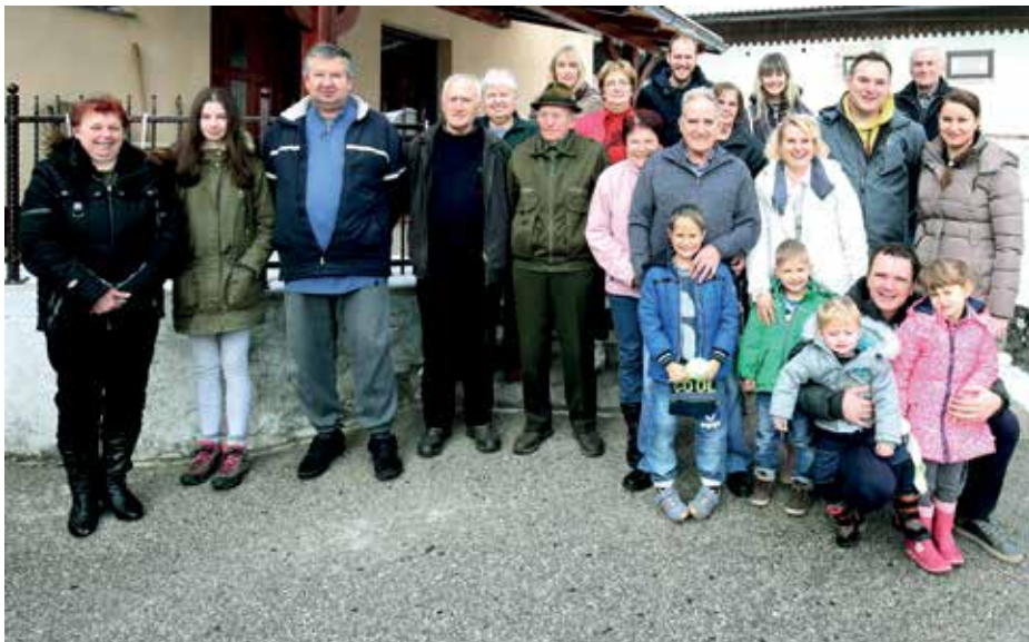
Hruškarci so med seboj zelo povezani, obiskovalcu takoj naštejejo odlike svojih sovaščanov.