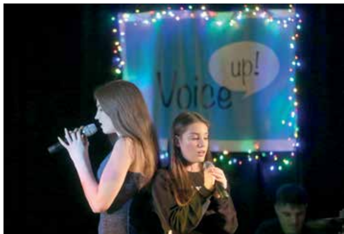
S petjem v novo leto