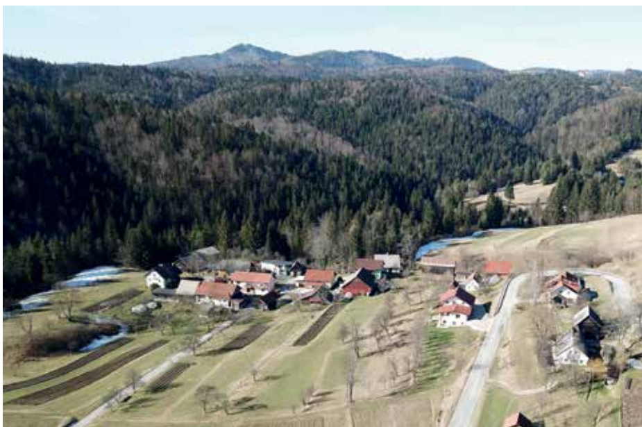
V osrednji del vasi pridemo od Bečajev. Zdaj, ko imajo smerokaz, s tem ni več težav.