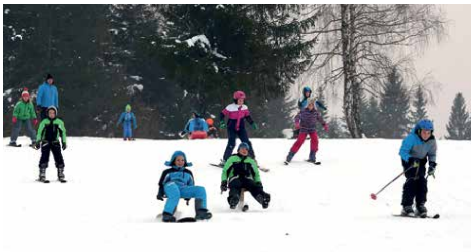
V SK Cerknica želijo za smučanje navdušiti čim več otrok.