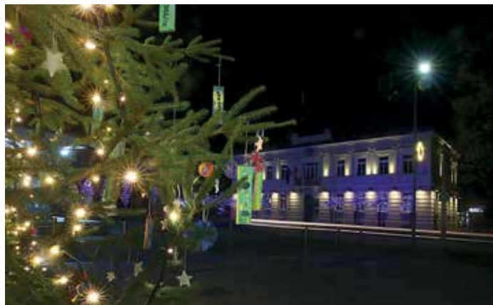
Praznično okrašena Cerknica

Tudi letošnje decembrsko dogajanje je v občini Cerknica postreglo z obilo dogodki in prireditvami. Osrednji progam je potekal pod okriljem Kulturnega doma Cerknica, izvedbo pa sta omogočila Občina Cerknica in Notranjski regijski park, kar pa ne pomeni, da se ni vrsta dogodkov v organizaciji različnih društev odvila tudi v ostalih krajih občine. Nekaj utrinkov prazničnega decembra je ujel fotograf Ljubo Vukelič .