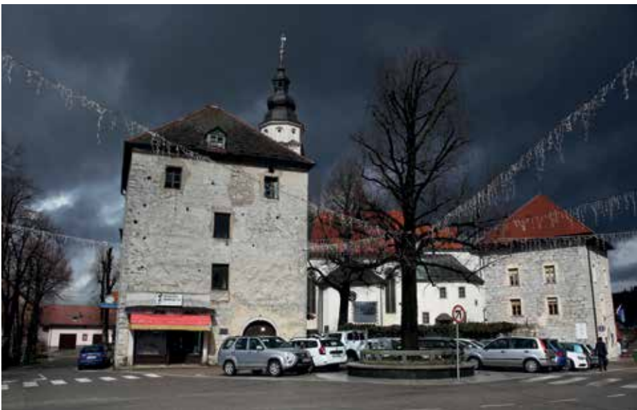
Tabor je razglašen kot kulturni spomenik lokalnega pomena.