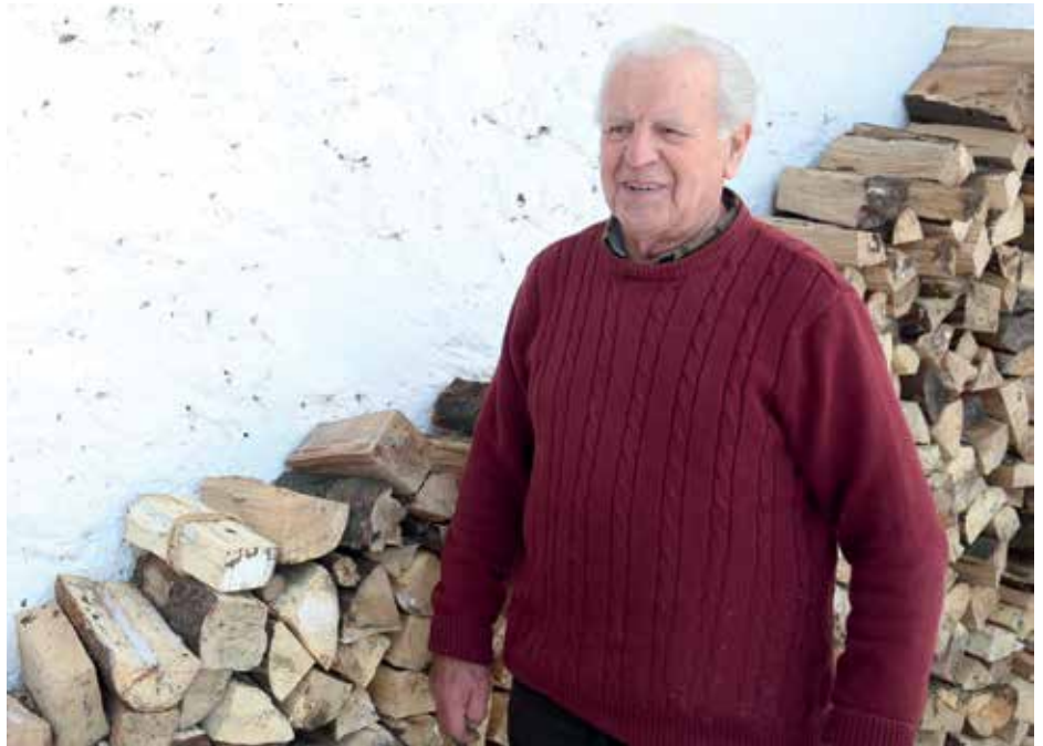
Poznavalec starih sadnih vrst

V stari Avstriji so pobrali zvonova za vojsko. Teta in njen mož, ki je bil logar, sta stanovala v stari hiši v Javorniku. Imel je zveze s Trnjem pri Pivki, kjer so zamenjevali zvonove; vas je bila takrat, okrog leta 1920, že na italijanski strani. Tam je bil en zvon, ki so ga prešvercali čez mejo in sem dali. Morali so vedeti, da ko bo zazvonilo, da bo nekaj narobe. Carina je bila pri Varhu. So takoj prišli. Tisti zvon so morali