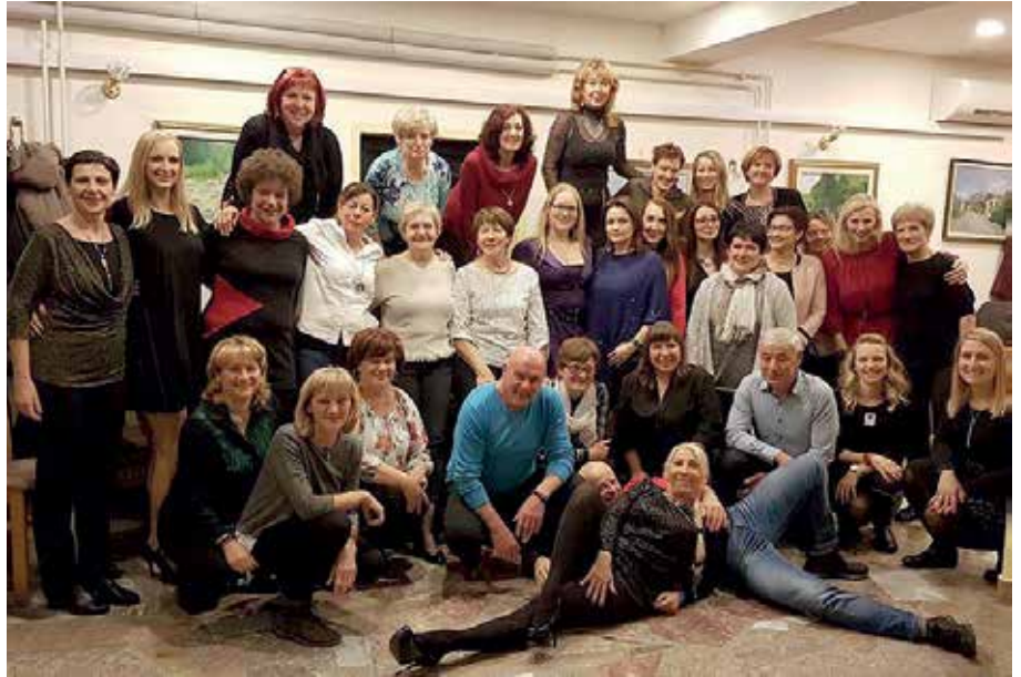
Vsako leto v društvu organiziramo tudi prednovoletno srečanje.

Posamezne vadbe se med seboj razlikujejo. Power kick je, kot že rečeno, eksplozivna vadba, ki kombinira gibanje in elemente borilnih veščin. Vadba je nabita z adrenalinom in energijo. Funkcionalna vadba zajema osnovne