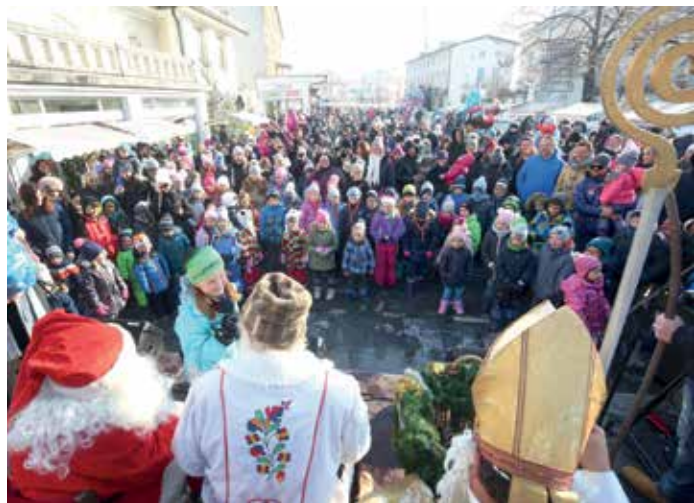
Trije dobri možje na obisku